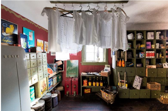
Wohnhaus mit historischem Laden, Friesenhausen, Foto M. Stadler, Fotoclub Zeil

Zur aktuellen redaktionellen Berichterstattung stellen wir Ihnen gerne Bildmaterial zum Download unter www.blfd.bayern.de/blfd/presse zur Verfügung. Bei einer anderweitigen Nutzung bitten wir Sie, selbständig die Fragen des Urheber- und Nutzungsrechts zu klären.