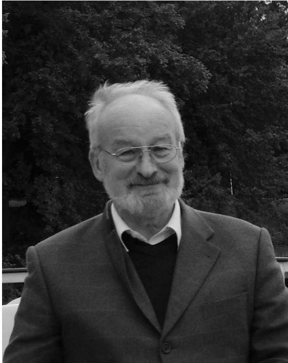
Helmuth Richter, Foto privat

Zur aktuellen redaktionellen Berichterstattung stellen wir Ihnen gerne Bildmaterial zum Download unter www.blfd.bayern.de/blfd/presse zur Verfügung. Bei einer anderweitigen Nutzung bitten wir Sie, selbständig die Fragen des Urheber- und Nutzungsrechts zu klären.