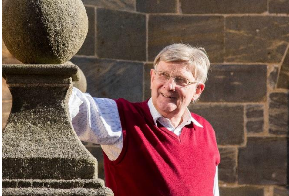
Günter Lipp, Foto privat

Zur aktuellen redaktionellen Berichterstattung stellen wir Ihnen gerne Bildmaterial zum Download unter www.blfd.bayern.de/blfd/presse zur Verfügung. Bei einer anderweitigen Nutzung bitten wir Sie, selbständig die Fragen des Urheber- und Nutzungsrechts zu klären.