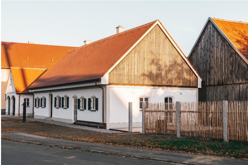
Bauernhaus, Brunnen, Foto Maier und Reinhardt

Zur aktuellen redaktionellen Berichterstattung stellen wir Ihnen gerne Bildmaterial zum Download unter www.blfd.bayern.de/blfd/presse zur Verfügung. Bei einer anderweitigen Nutzung bitten wir Sie, selbständig die Fragen des Urheber- und Nutzungsrechts zu klären.