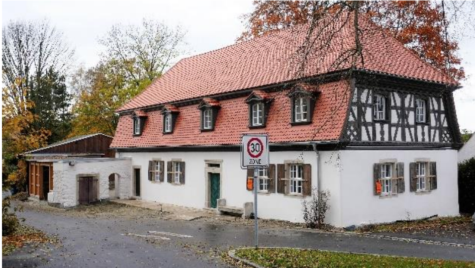
Förderverein hist. Baudenkmäler, Hohenberg a.d. Eger, Milchhof

Zur aktuellen redaktionellen Berichterstattung stellen wir Ihnen gerne Bildmaterial zum Download unter www.blfd.bayern.de/blfd/presse zur Verfügung. Bei einer anderweitigen Nutzung bitten wir Sie, selbständig die Fragen des Urheber- und Nutzungsrechts zu klären.