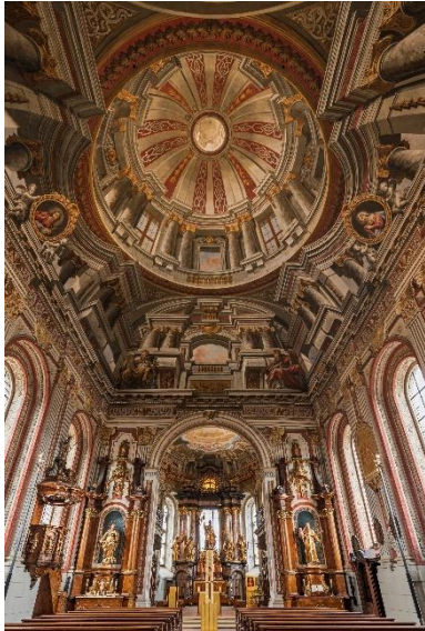
Pfarrkirche St. Mauritius, Wiesentheid

Zur aktuellen redaktionellen Berichterstattung stellen wir Ihnen gerne Bildmaterial zum Download unter www.blfd.bayern.de/blfd/presse zur Verfügung. Bei einer anderweitigen Nutzung bitten wir Sie, selbständig die Fragen des Urheber- und Nutzungsrechts zu klären.