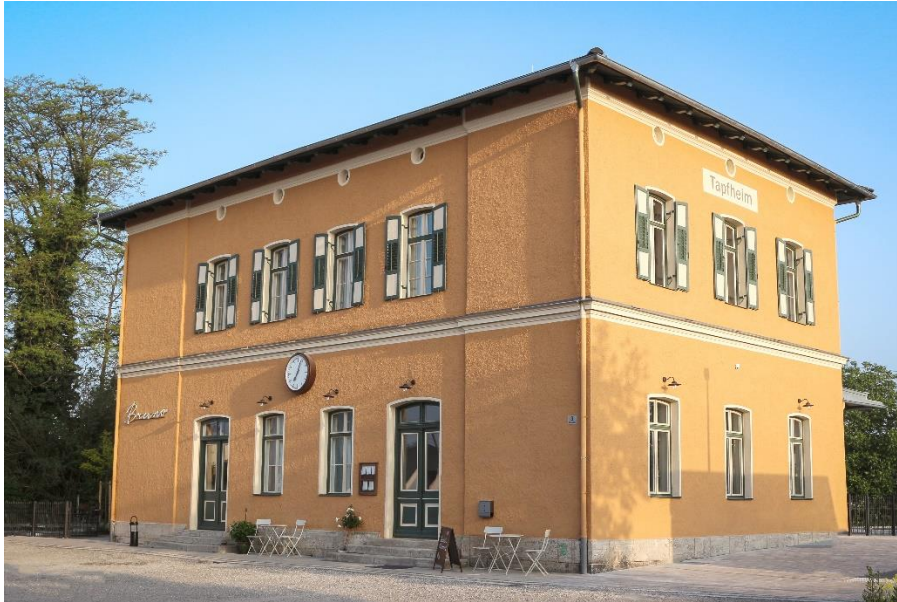
Bahnhof, Tapfheim

Zur aktuellen redaktionellen Berichterstattung stellen wir Ihnen gerne Bildmaterial zum Download unter www.blfd.bayern.de/blfd/presse zur Verfügung. Bei einer anderweitigen Nutzung bitten wir Sie, selbständig die Fragen des Urheber- und Nutzungsrechts zu klären.