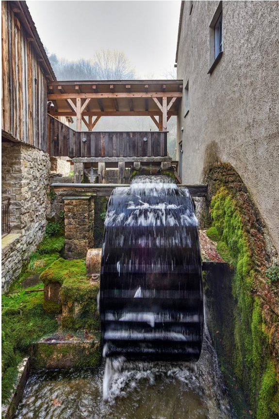
Jurahauss-Ensemble Obermühle, Dietfurt-Mühlbach

Zur aktuellen redaktionellen Berichterstattung stellen wir Ihnen gerne Bildmaterial zum Download unter www.blfd.bayern.de/blfd/presse zur Verfügung. Bei einer anderweitigen Nutzung bitten wir Sie, selbständig die Fragen des Urheber- und Nutzungsrechts zu klären.