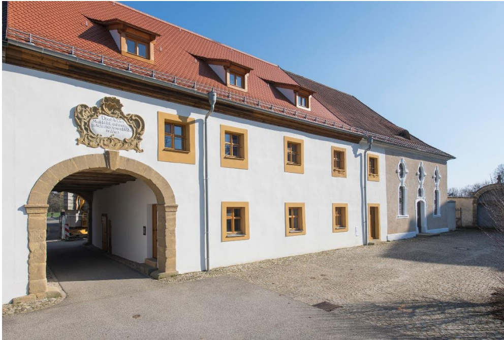
Haus der Dorfkultur, Speinshart

Zur aktuellen redaktionellen Berichterstattung stellen wir Ihnen gerne Bildmaterial zum Download unter www.blfd.bayern.de/blfd/presse zur Verfügung. Bei einer anderweitigen Nutzung bitten wir Sie, selbständig die Fragen des Urheber- und Nutzungsrechts zu klären.