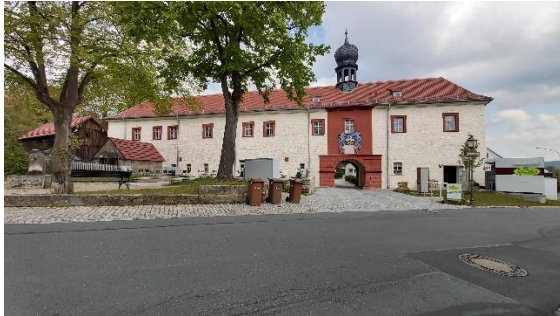
Schloss Emtmannsberg

Zur aktuellen redaktionellen Berichterstattung stellen wir Ihnen gerne Bildmaterial zum Download unter www.blfd.bayern.de/blfd/presse zur Verfügung. Bei einer anderweitigen Nutzung bitten wir Sie, selbständig die Fragen des Urheber- und Nutzungsrechts zu klären.