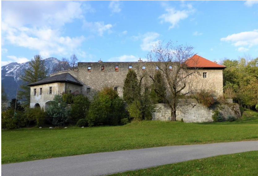
Burg Gruttenstein, Bad Reichenhall

Zur aktuellen redaktionellen Berichterstattung stellen wir Ihnen gerne Bildmaterial zum Download unter www.blfd.bayern.de/blfd/presse zur Verfügung. Bei einer anderweitigen Nutzung bitten wir Sie, selbständig die Fragen des Urheber- und Nutzungsrechts zu klären.