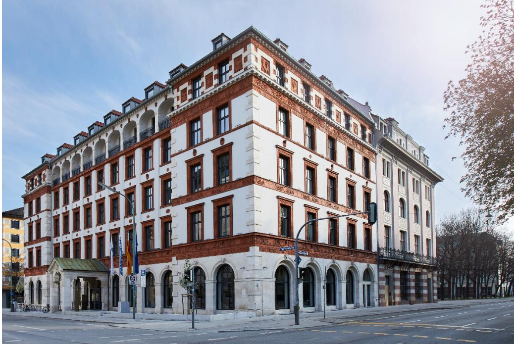
Stammhaus der Industrie- und Handelskammer, München

Zur aktuellen redaktionellen Berichterstattung stellen wir Ihnen gerne Bildmaterial zum Download unter www.blfd.bayern.de/blfd/presse zur Verfügung. Bei einer anderweitigen Nutzung bitten wir Sie, selbständig die Fragen des Urheber- und Nutzungsrechts zu klären.