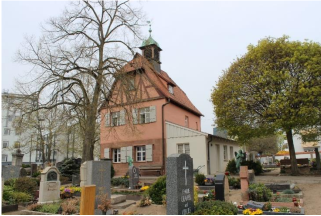
Totengräberhäuschen der Evangelischen der Kirchengemeinde St. Bartholomäus

Zur aktuellen redaktionellen Berichterstattung stellen wir Ihnen gerne Bildmaterial zum Download unter www.blfd.bayern.de/blfd/presse zur Verfügung. Bei einer anderweitigen Nutzung bitten wir Sie, selbständig die Fragen des Urheber- und Nutzungsrechts zu klären.