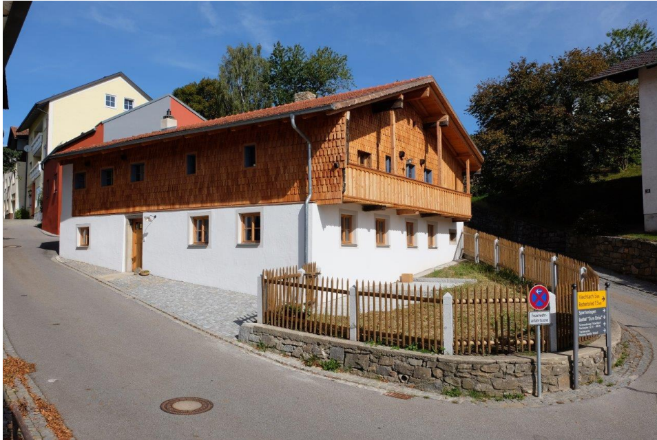
Ehemaliges Handwerkerhaus, Kollnburg

Zur aktuellen redaktionellen Berichterstattung stellen wir Ihnen gerne Bildmaterial zum Download unter www.blfd.bayern.de/blfd/presse zur Verfügung. Bei einer anderweitigen Nutzung bitten wir Sie, selbständig die Fragen des Urheber- und Nutzungsrechts zu klären.