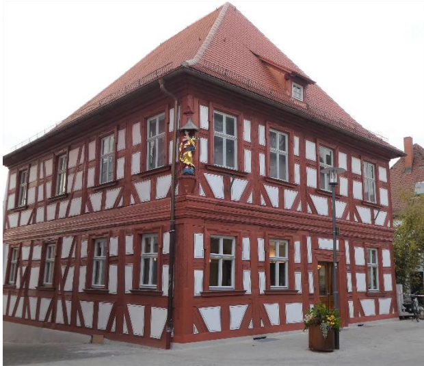
Gasthaus „Töpfla“, Höchststadt a.d. Aisch, Foto privat

Zur aktuellen redaktionellen Berichterstattung stellen wir Ihnen gerne Bildmaterial zum Download unter www.blfd.bayern.de/blfd/presse zur Verfügung. Bei einer anderweitigen Nutzung bitten wir Sie, selbständig die Fragen des Urheber- und Nutzungsrechts zu klären.