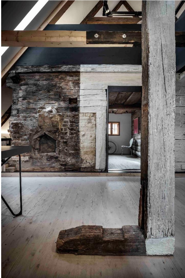
Holzblockhaus, Landshut

Zur aktuellen redaktionellen Berichterstattung stellen wir Ihnen gerne Bildmaterial zum Download unter www.blfd.bayern.de/blfd/presse zur Verfügung. Bei einer anderweitigen Nutzung bitten wir Sie, selbständig die Fragen des Urheber- und Nutzungsrechts zu klären.