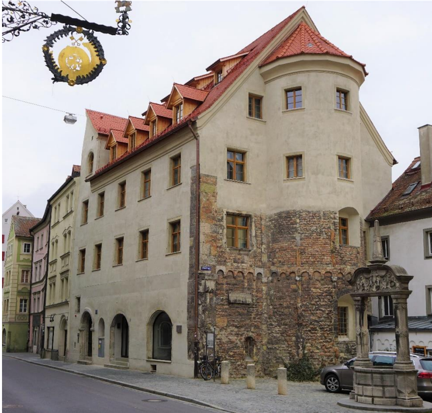
Ehemalige Kapelle, heutiges Wohnhaus, Regensburg, Foto privat

Zur aktuellen redaktionellen Berichterstattung stellen wir Ihnen gerne Bildmaterial zum Download unter www.blfd.bayern.de/blfd/presse zur Verfügung. Bei einer anderweitigen Nutzung bitten wir Sie, selbständig die Fragen des Urheber- und Nutzungsrechts zu klären.