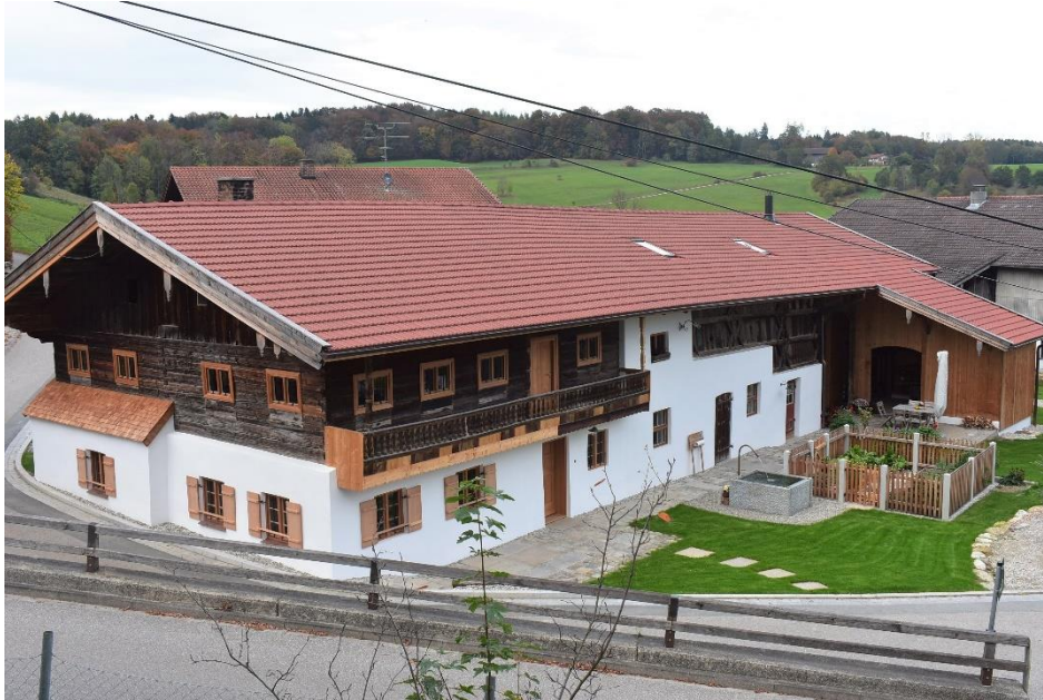
Bauernhaus, Steinhöring, Foto privat

Zur aktuellen redaktionellen Berichterstattung stellen wir Ihnen gerne Bildmaterial zum Download unter www.blfd.bayern.de/blfd/presse zur Verfügung. Bei einer anderweitigen Nutzung bitten wir Sie, selbständig die Fragen des Urheber- und Nutzungsrechts zu klären.