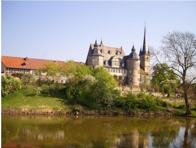
Schloss Ahorn

Zur aktuellen redaktionellen Berichterstattung stellen wir Ihnen gerne Bildmaterial zum Download unter www.blfd.bayern.de/blfd/presse zur Verfügung. Bei einer anderweitigen Nutzung bitten wir Sie, selbständig die Fragen des Urheber- und Nutzungsrechts zu klären.