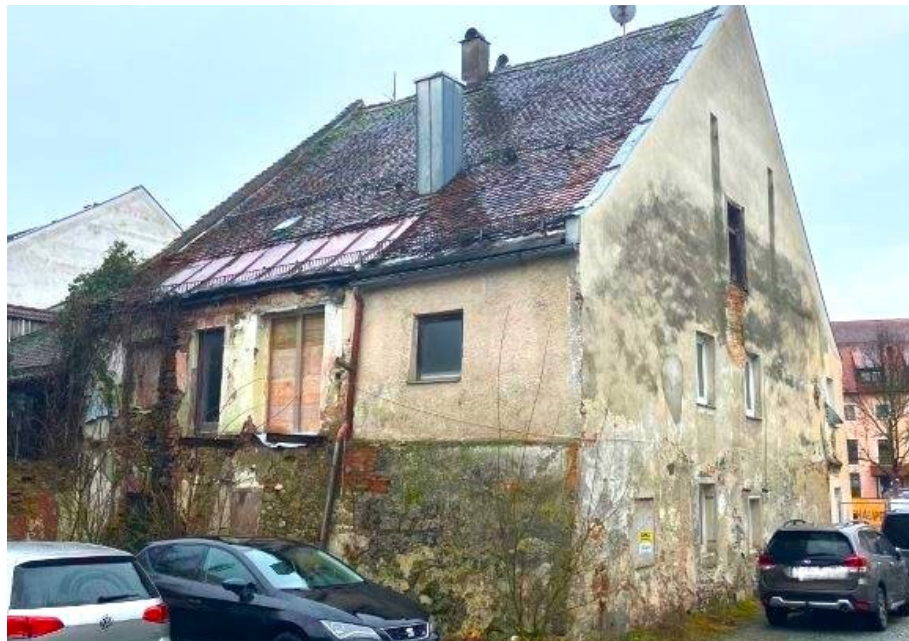
Rückseite des historischen Innenstadtbaus