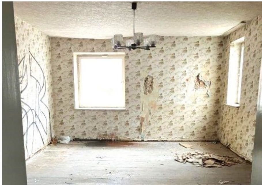
Früherer Wohnraum mit Tapete und Dielenboden im OG