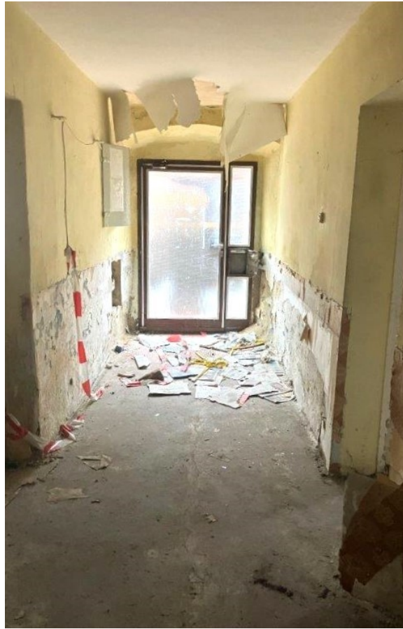
Eingangsflur mit Gewölbe