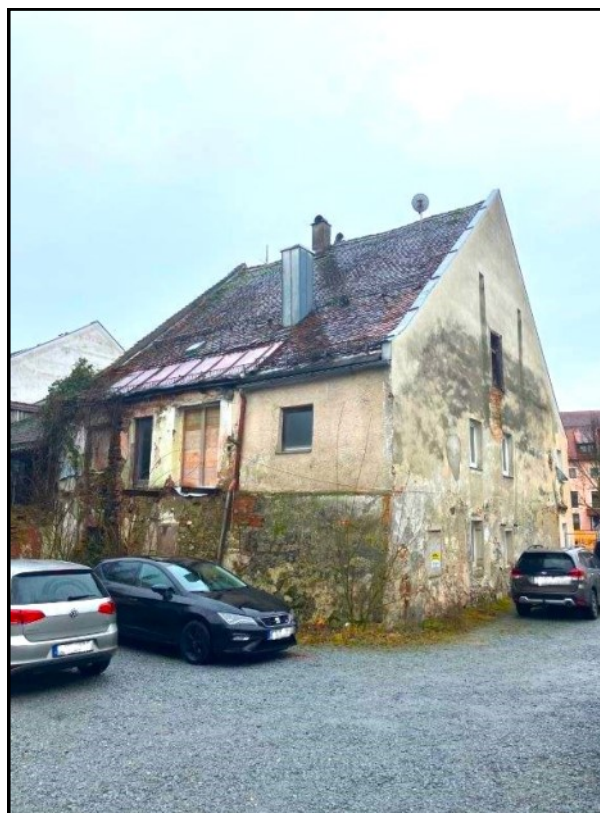
Historisches Handwerkerhaus von seiner Rückseite

Der erfolgreiche Verkauf des Anwesens sowie anderweitige Sachverhaltsänderungen sind dem BLfD unverzüglich mitzuteilen. Die Beschreibung des Denkmals (Objektexposé) wird dann auf entsprechenden Hinweis des Verkäufers entfernt werden. Schäden, die durch unterlassene oder fehlerhafte Informationen des Verkäufers entstehen, sind von diesem zu tragen.