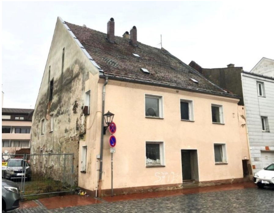
Früheres Handwerkerhaus in bester Lage