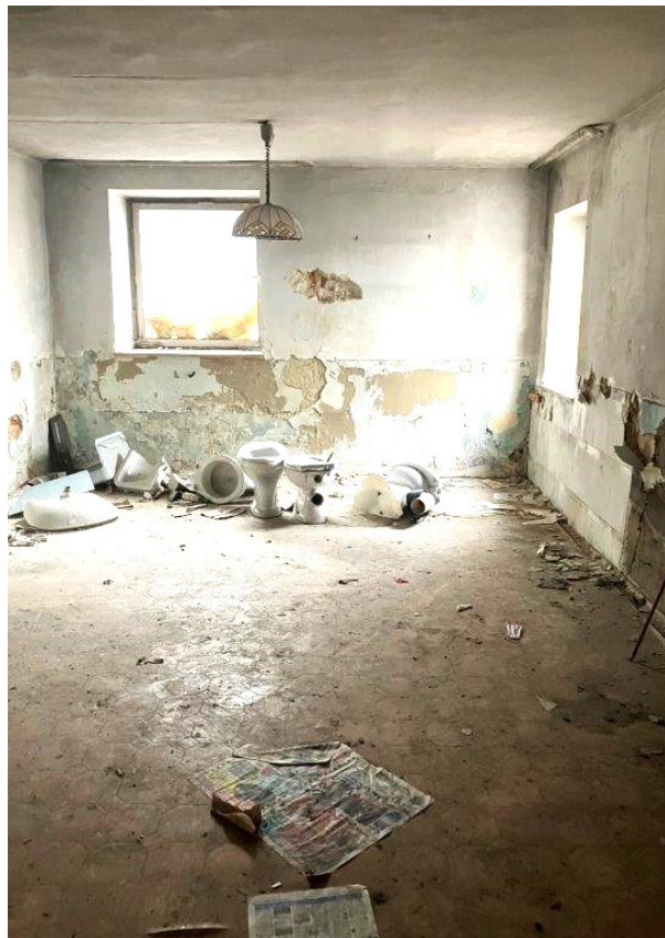
Neu gestaltbarer Wohnraum