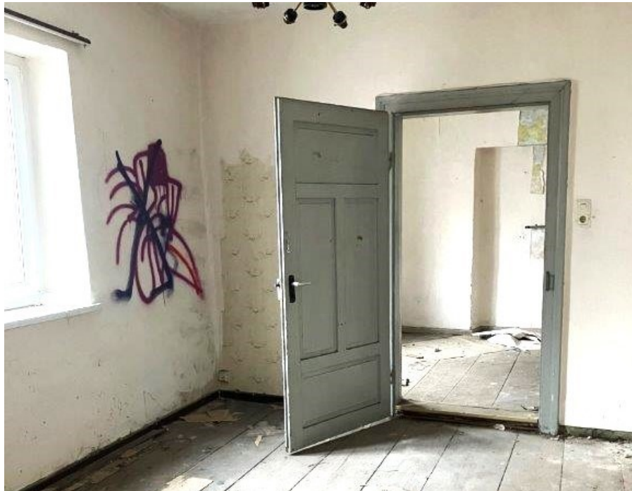
Historische Raumfolge im OG