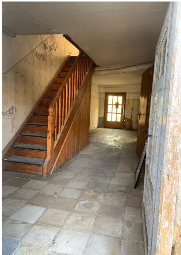
Breiter Flur im EG mit historischer Treppe