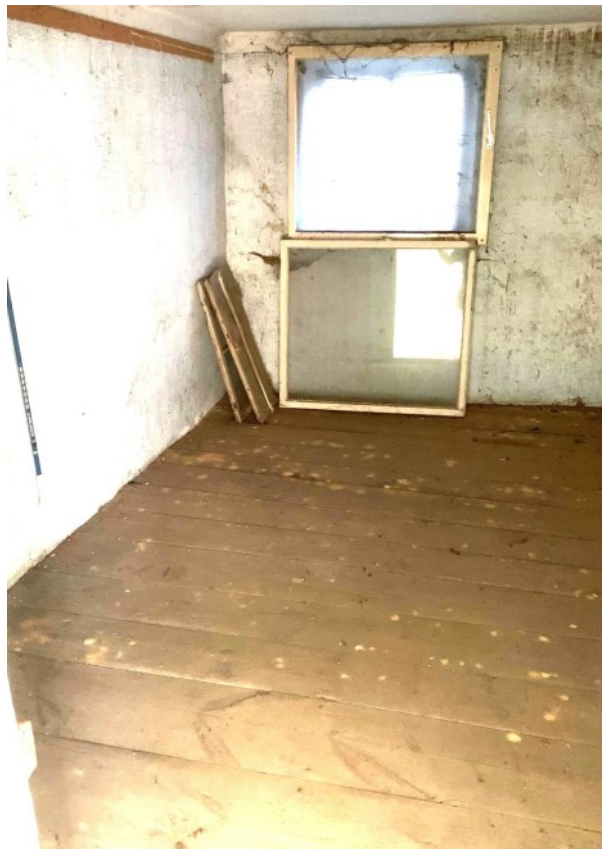
Wohnraum mit Dielenboden aus vergangener Zeit