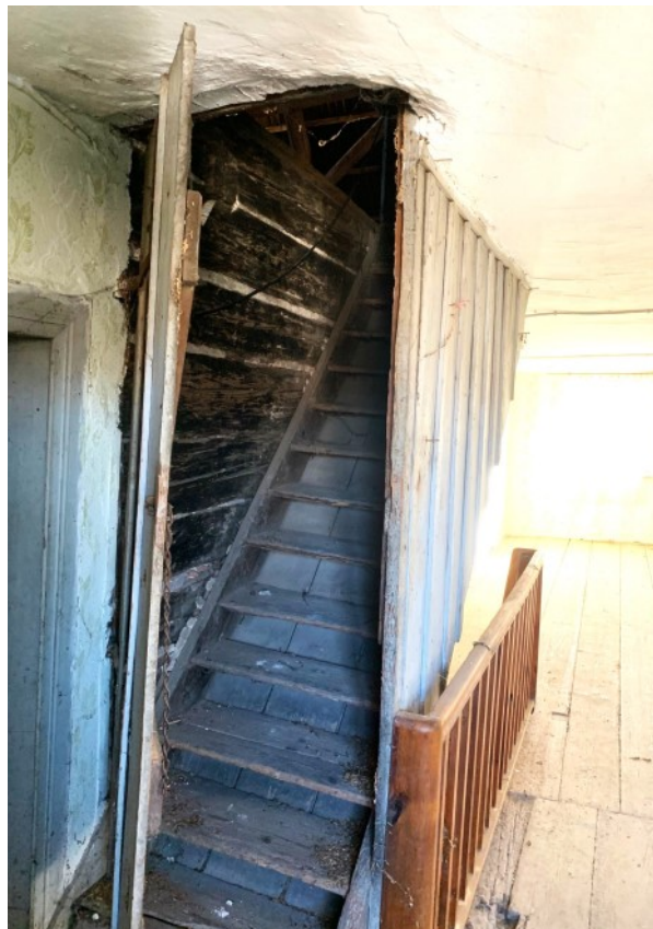
Treppenaufgang ins DG