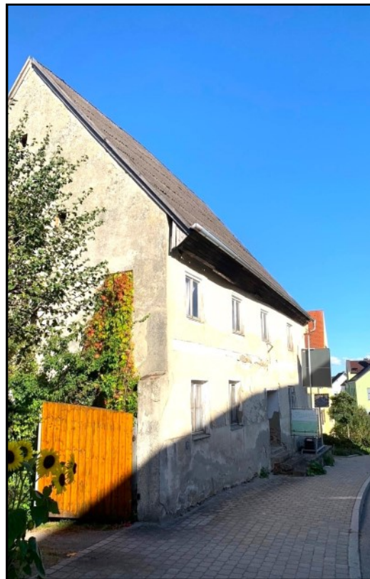
Historisches Bauernhaus des späten Mittelalters

Der erfolgreiche Verkauf des Anwesens sowie anderweitige Sachverhaltsänderungen sind dem BLfD unverzüglich mitzuteilen. Die Beschreibung des Denkmals (Objektexposé) wird dann auf entsprechenden Hinweis des Verkäufers entfernt werden. Schäden, die durch unterlassene oder fehlerhafte Informationen des Verkäufers entstehen, sind von diesem zu tragen.