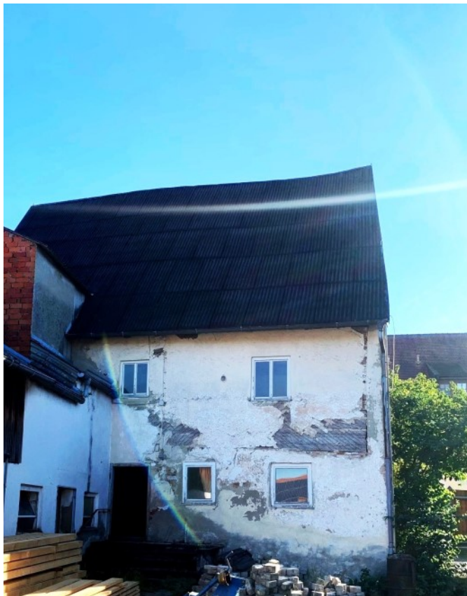
Rückseite des historischen Bauernhauses