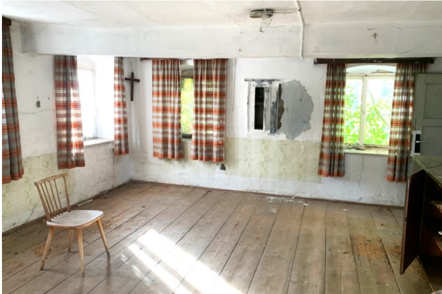
Gemütliche Bauernstube mit Wandkästchen