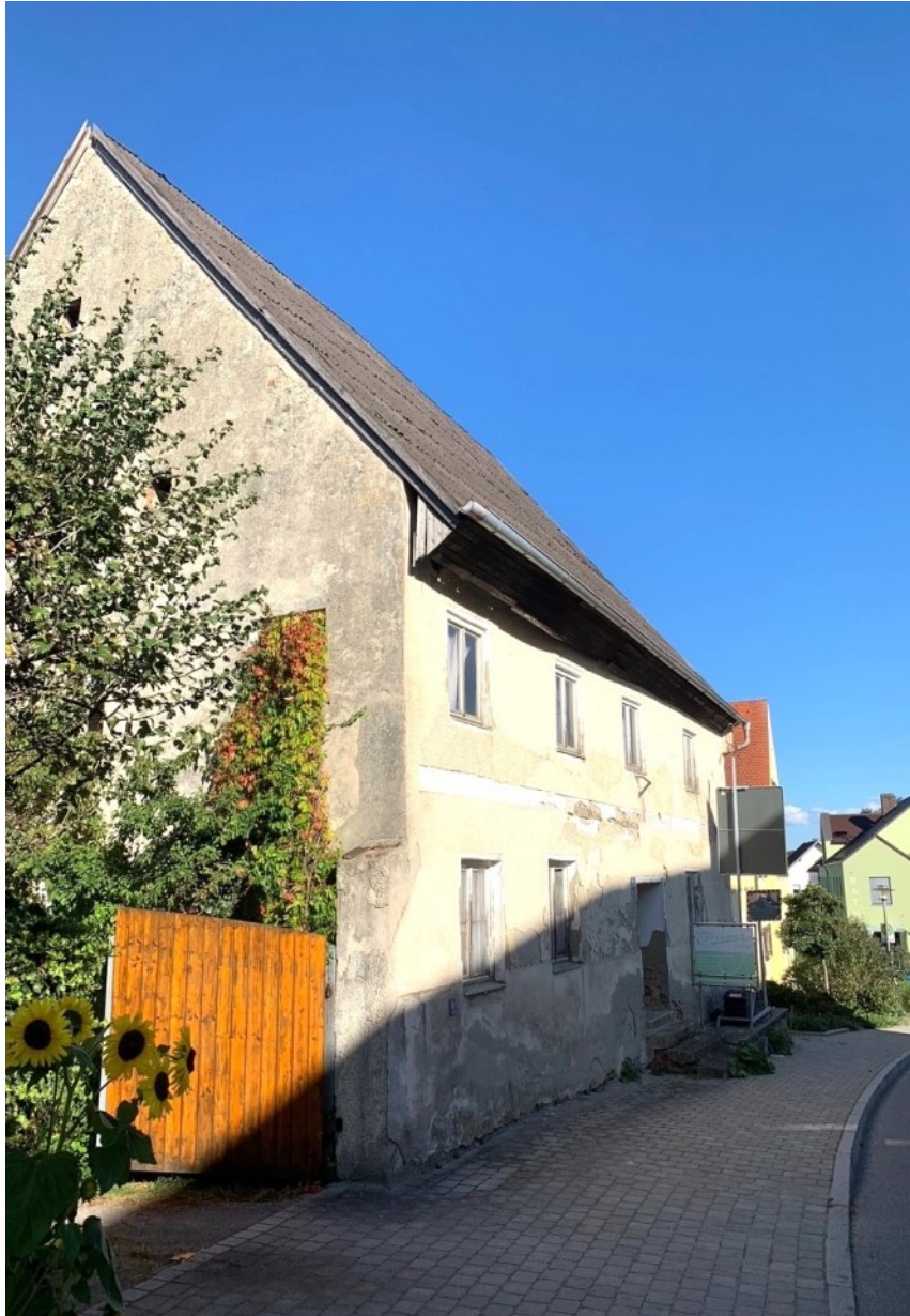
Ein Bauernhaus voll Geschichte