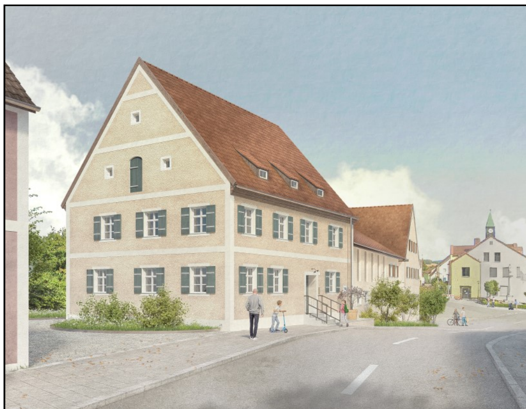
© A. Gassner / M. Jackermeier