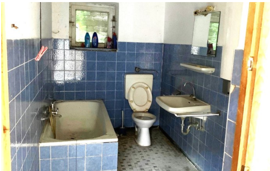
Tageslichtbad aus jüngerer Zeit