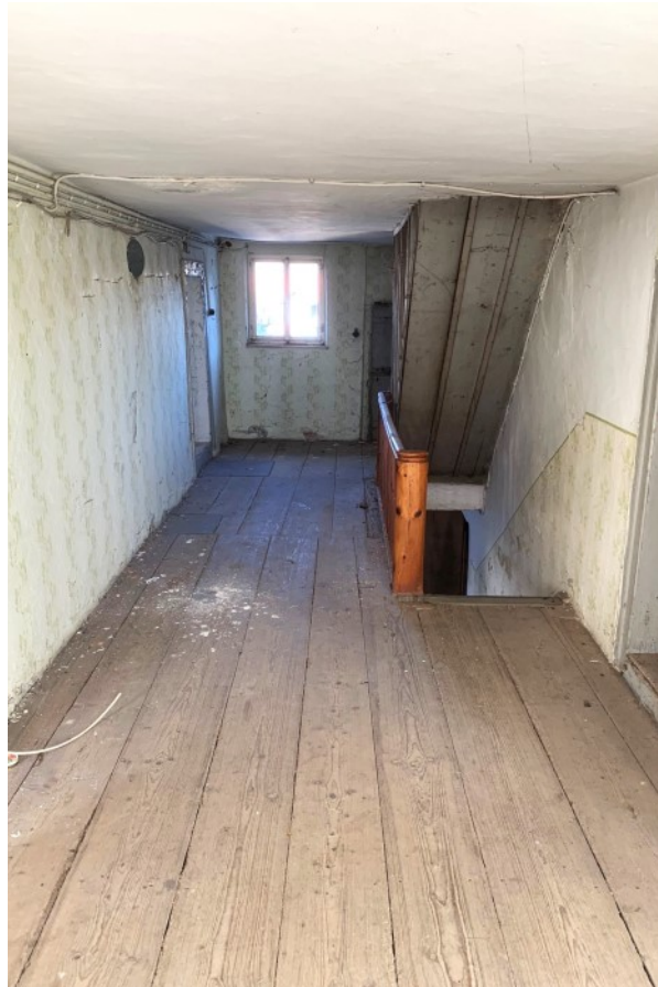
Flur im OG