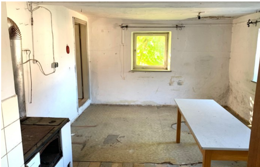
Ehemalige Küche im EG