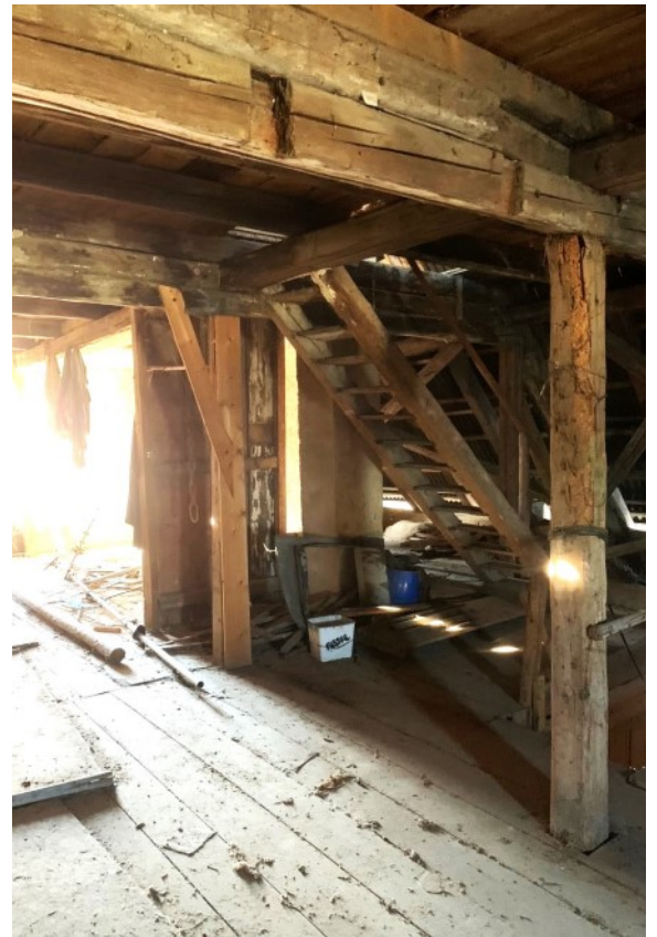
Beachtlicher Stauraum unter dem Dach