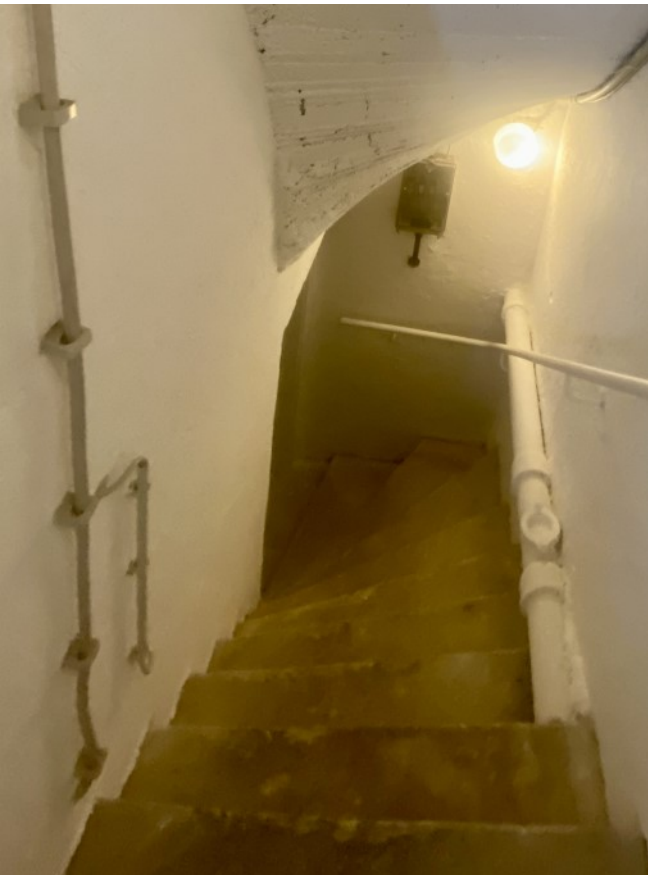
Treppe in den Keller