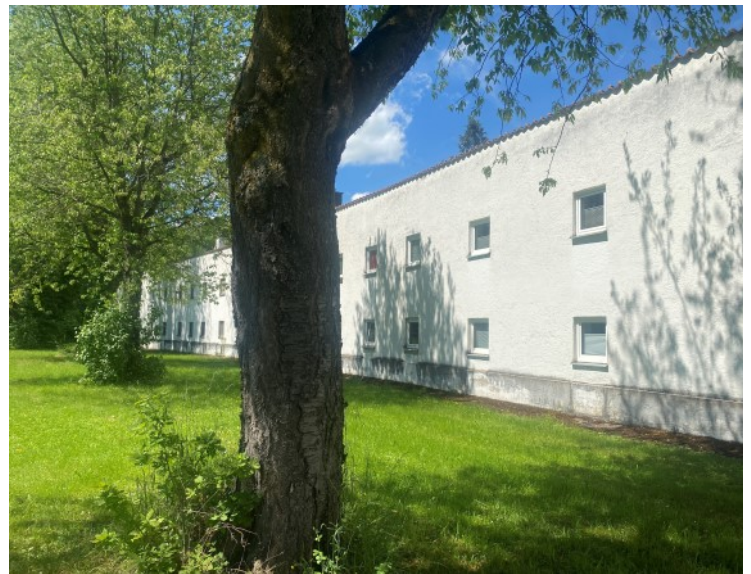
© (J. Lang) Historische Wohnanlage des 18. Jh.