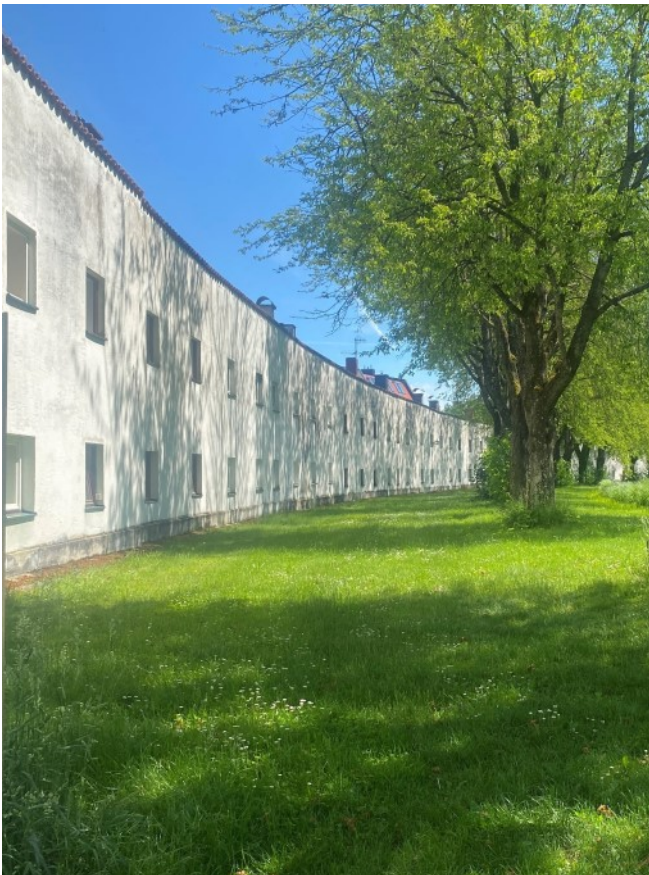
Blick auf die Rondellanlage