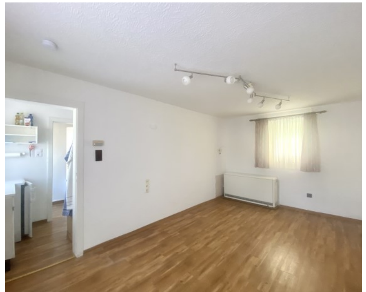
Attraktiver Wohnraum mit Küche