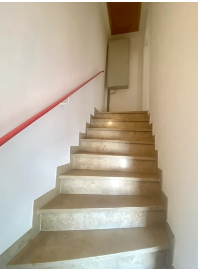
Treppenaufgang ins OG