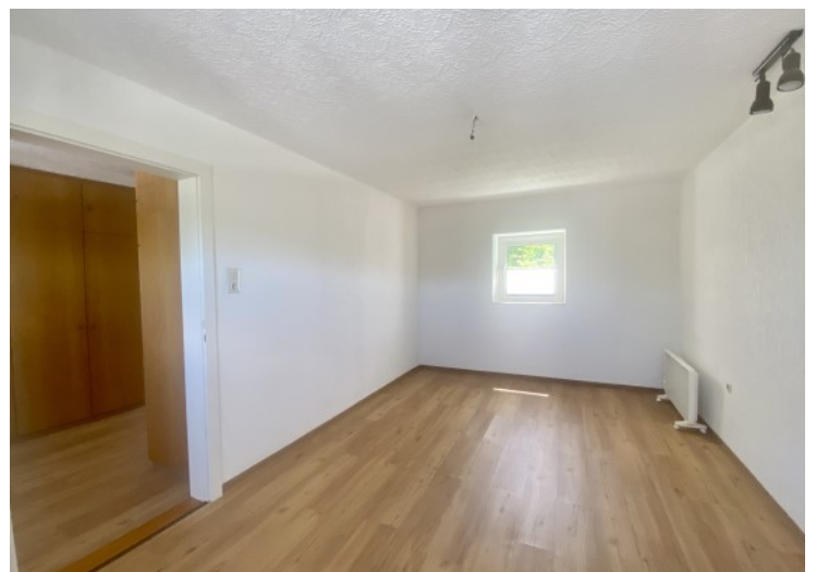
© (J. Lang) Zimmer mit Blick in den Schlosspark