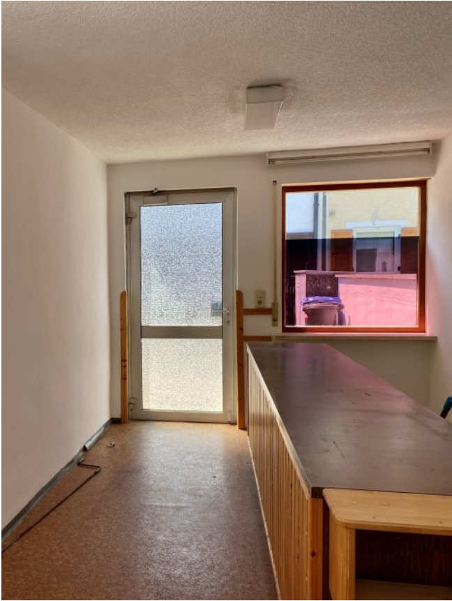
Vielseitig nutzbares Ladengeschäft