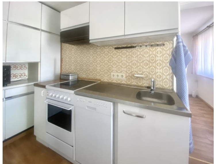
Kleine, funktionale Küche