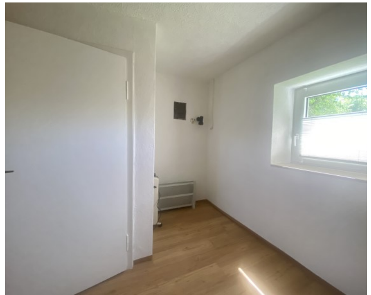
Vielseitig gestaltbares Zimmer