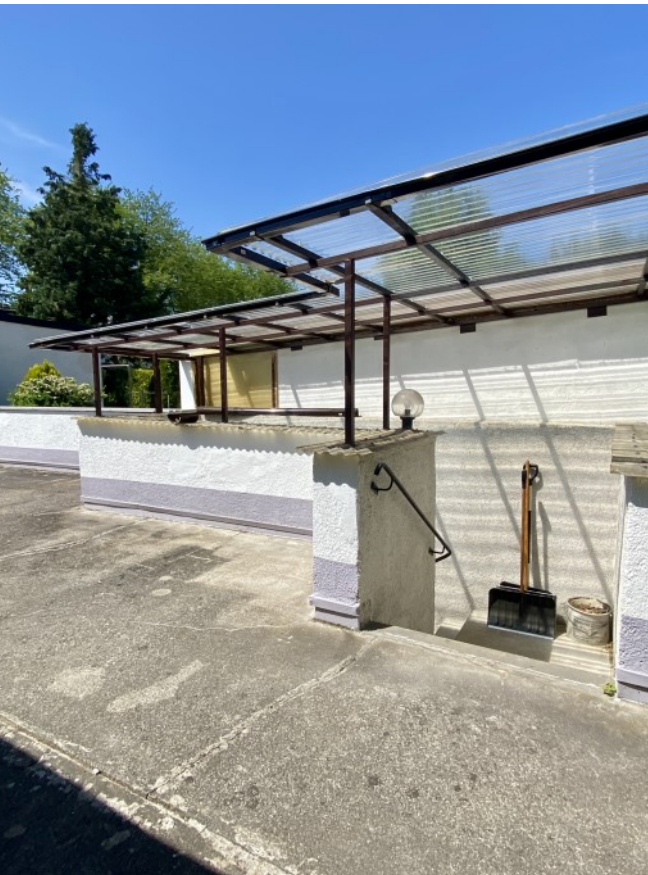
© (J. Lang) Abgang zu den Kellerräumen