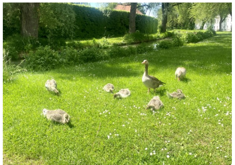
© (J. Lang) Ihre Nachbarn im Schlosspark