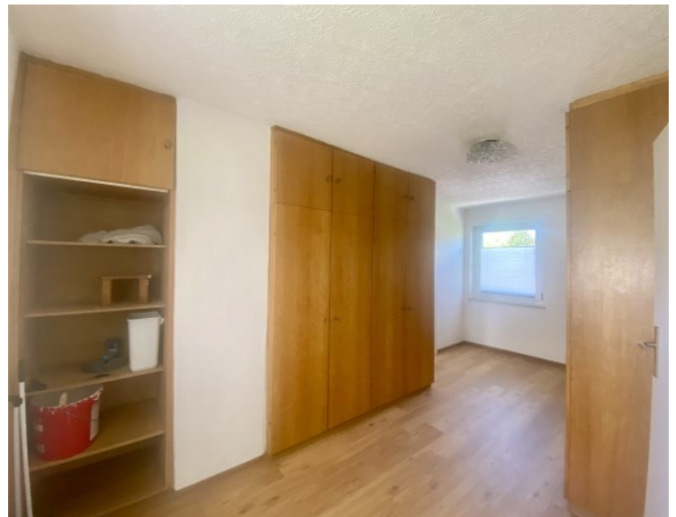
Wohnraum mit viel Stauraum