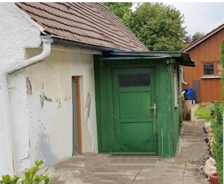
Vorbau mit Eingang zum Haus