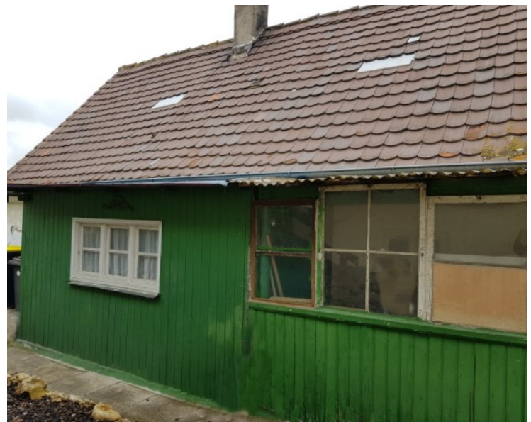
Kleiner Anbau aus jüngerer Zeit