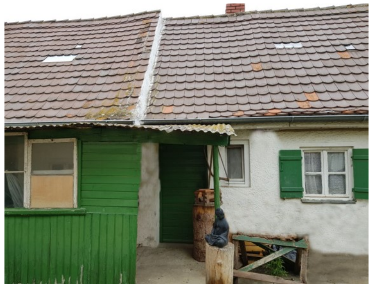
© (EdA) Anwesen mit reizvollen Fensterläden