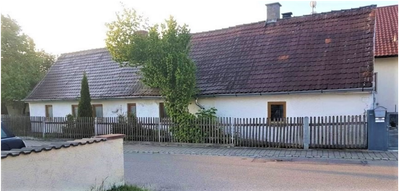
Langgestreckter Satteldachbau mit historischer Ausstrahlung