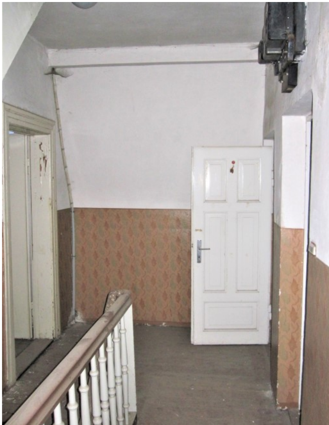
Flurbereich im DG