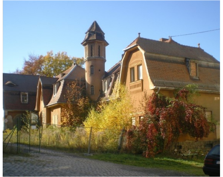
Das sog. Taubenhaus von Arzberg