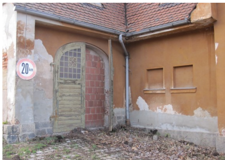
© (S. Hilpert) Großzügige Wohn- und Wirtschaftsgebäude