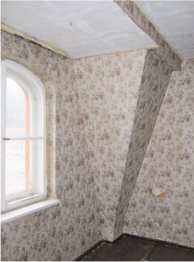
Zimmer mit historischem Fenster