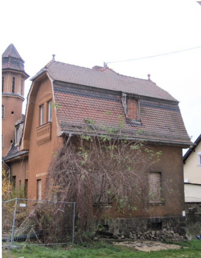
© (S. Hilpert) Ansprechender Bau zur Rechten