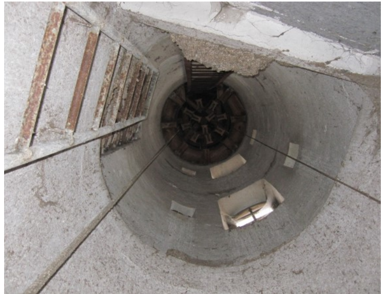
Aufgang zum Rundtürmchen