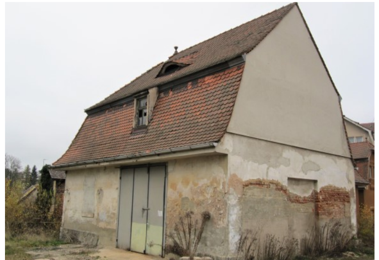
© (S. Hilpert) Großzügiges Gebäude zur Linken