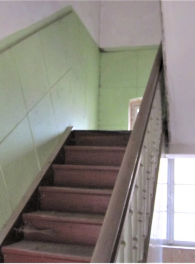
Treppenaufgang ins DG