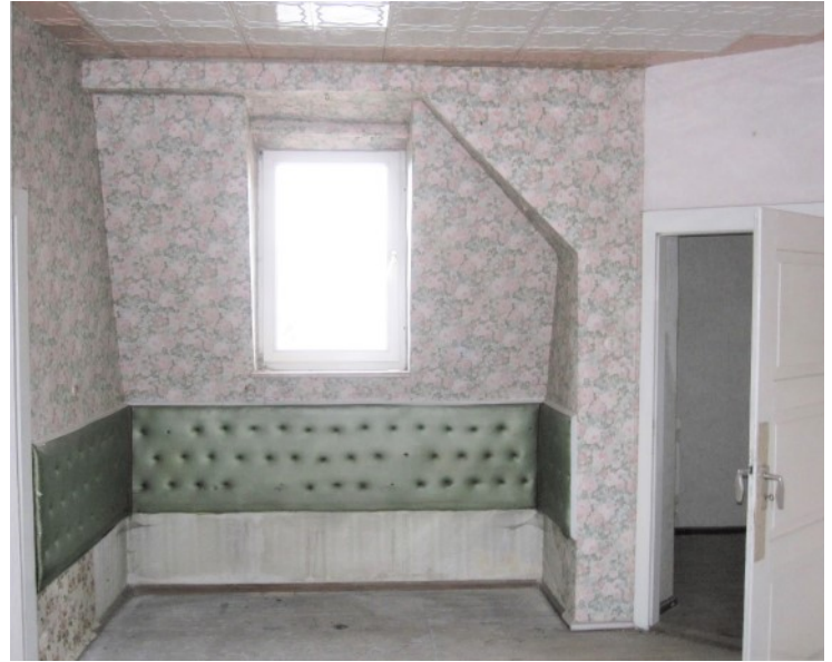
Wohnraum im Mansarddachgeschoss