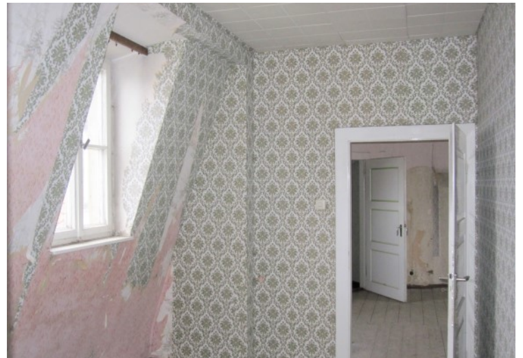
Historische Wohnräume im DG