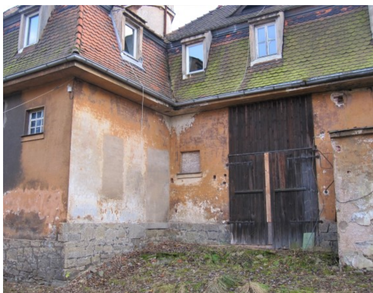
© (S. Hilpert) Ideale Bauten zum Wohnen & Arbeiten