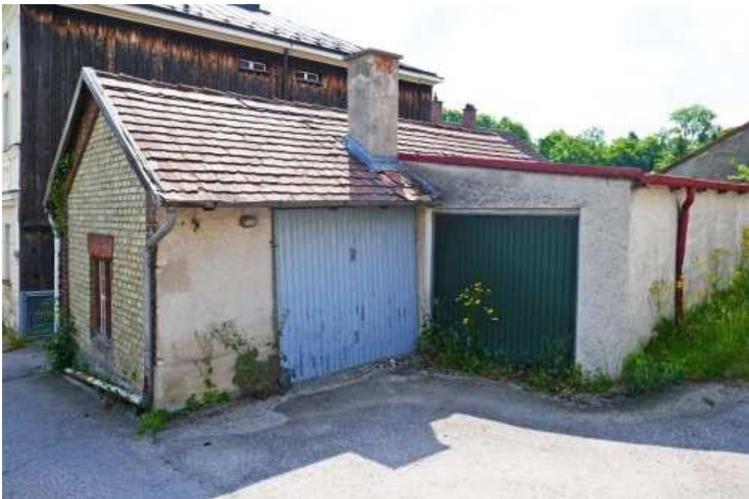
Garagenanbau am Waschhaus