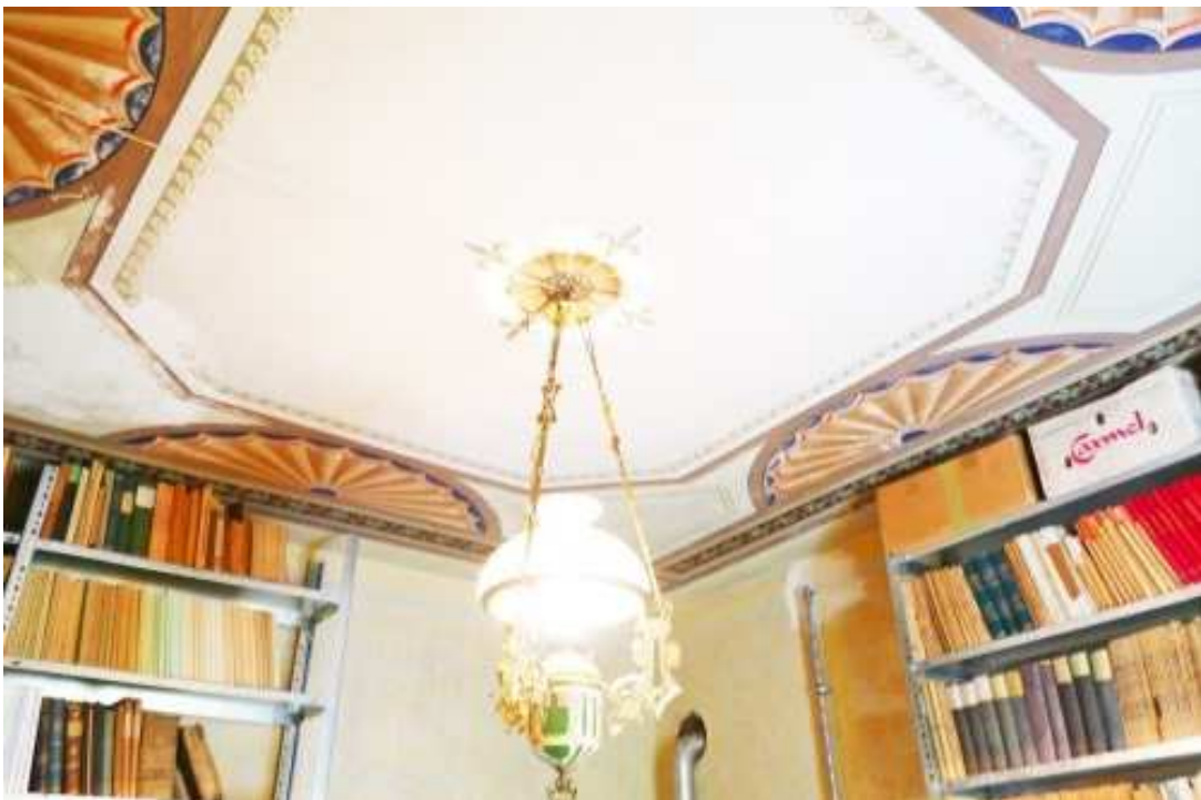
Malerisch gestaltete Decke