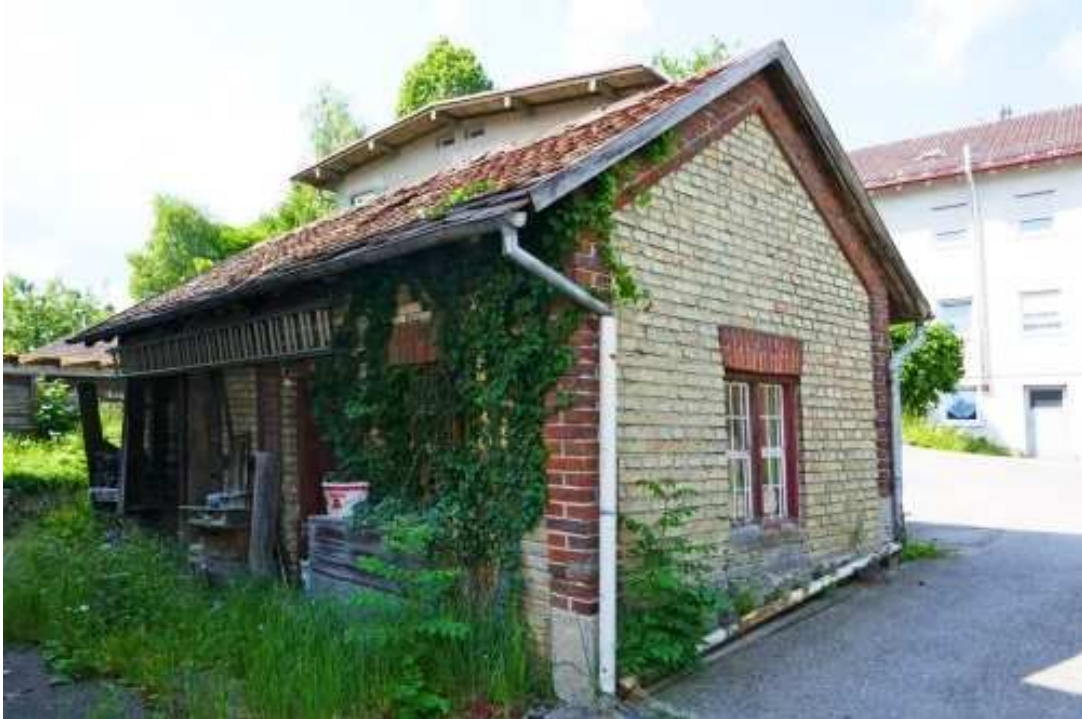
Waschküche und Holzlege