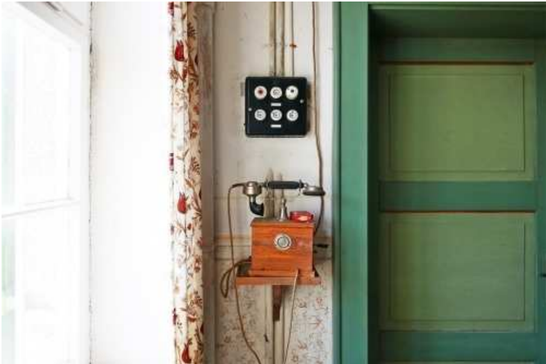
Historisches Telefon im Flur des Magazins