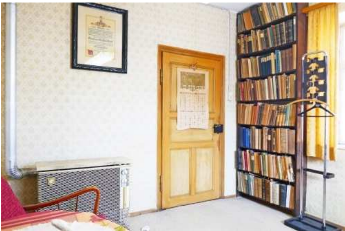
Gaseinzelofen und Eingang zum Studierzimmer