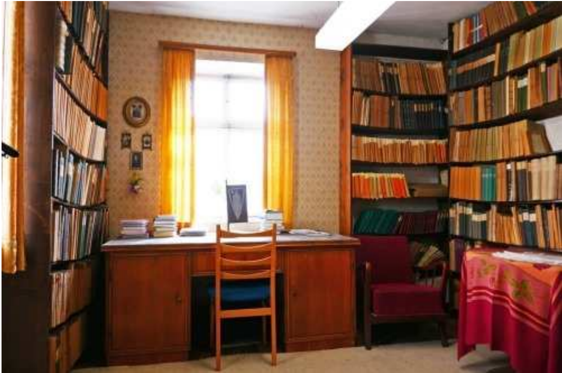
Studierzimmer im Erdgeschoss