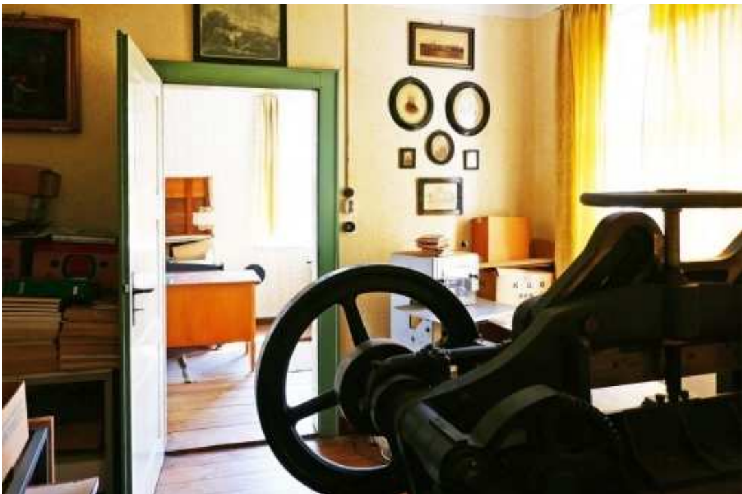
Zugang Büro im Magazin