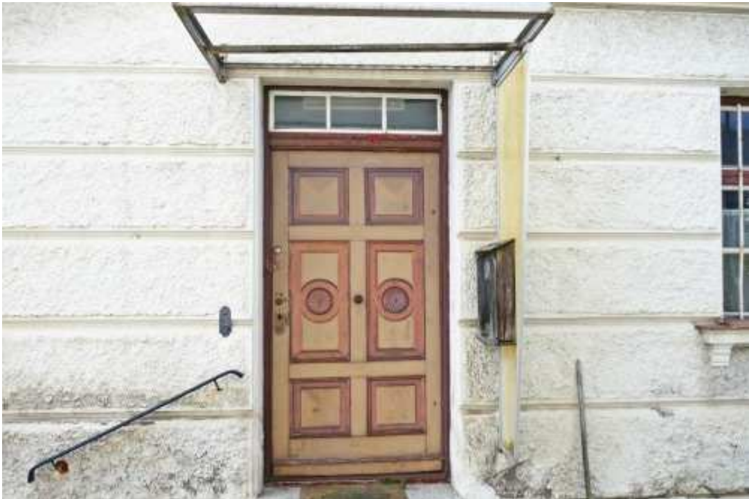
Holzeingangstür mit Kassetten und Beschlägen