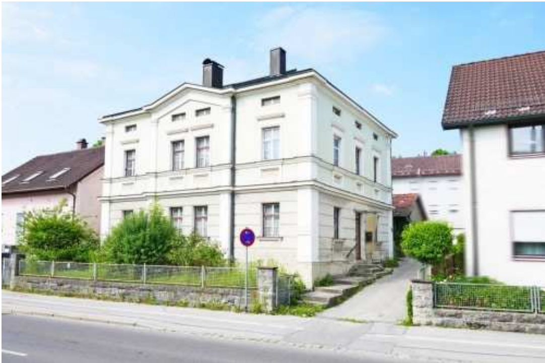
Zufahrt zum Grundstück