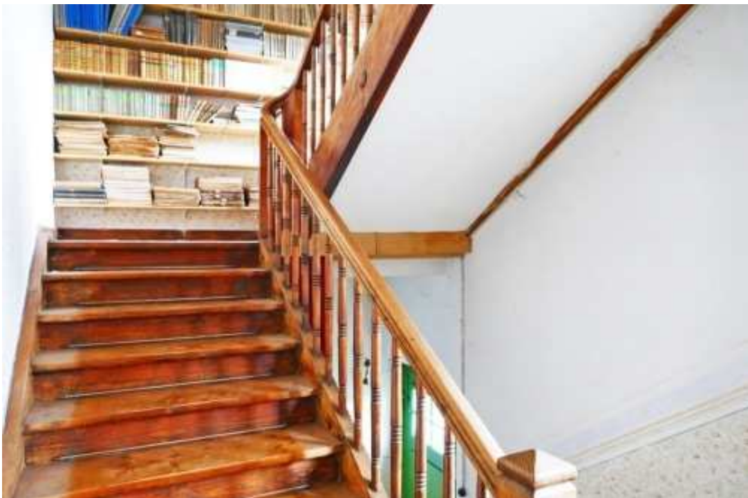
Breite Holztreppe im Magazin