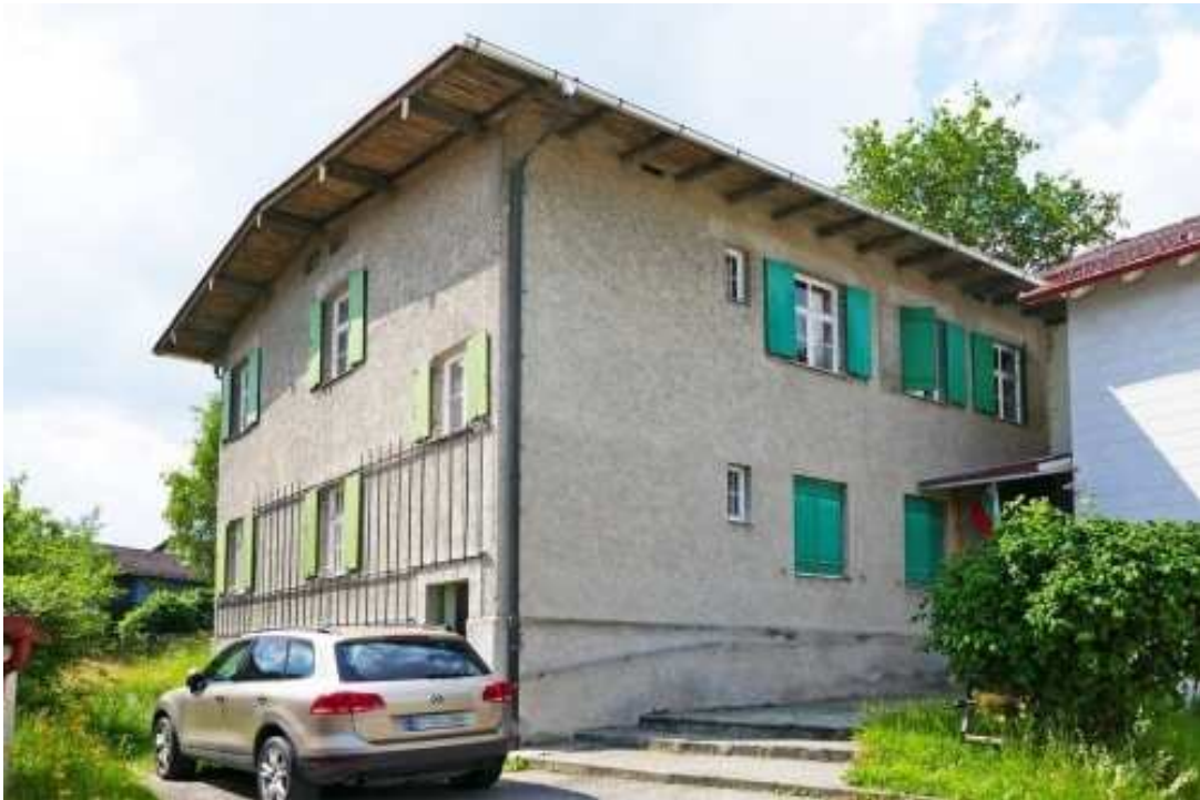
Außenansicht des Magazins