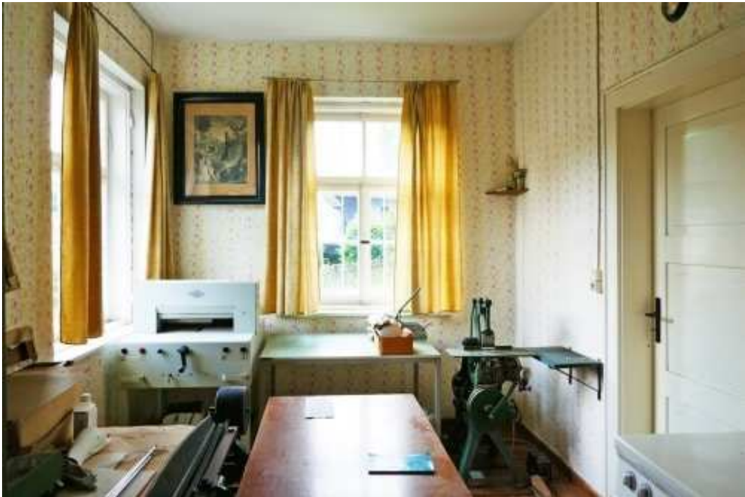
Arbeitszimmer im Magazin