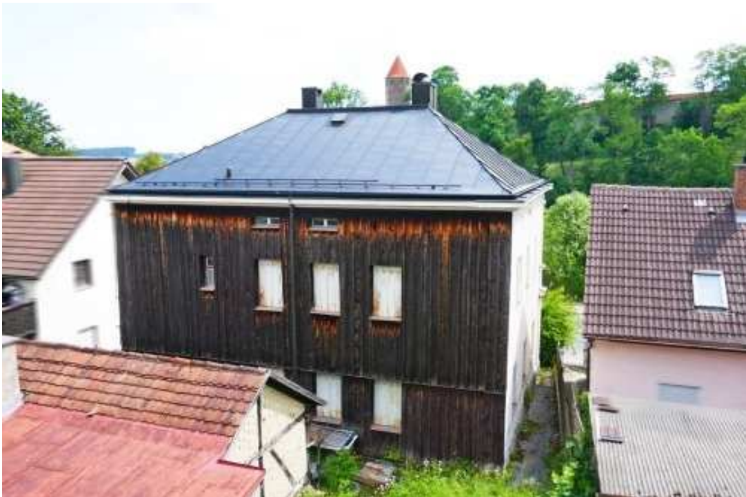
Rückseite des Gebäudes mit Holzschild