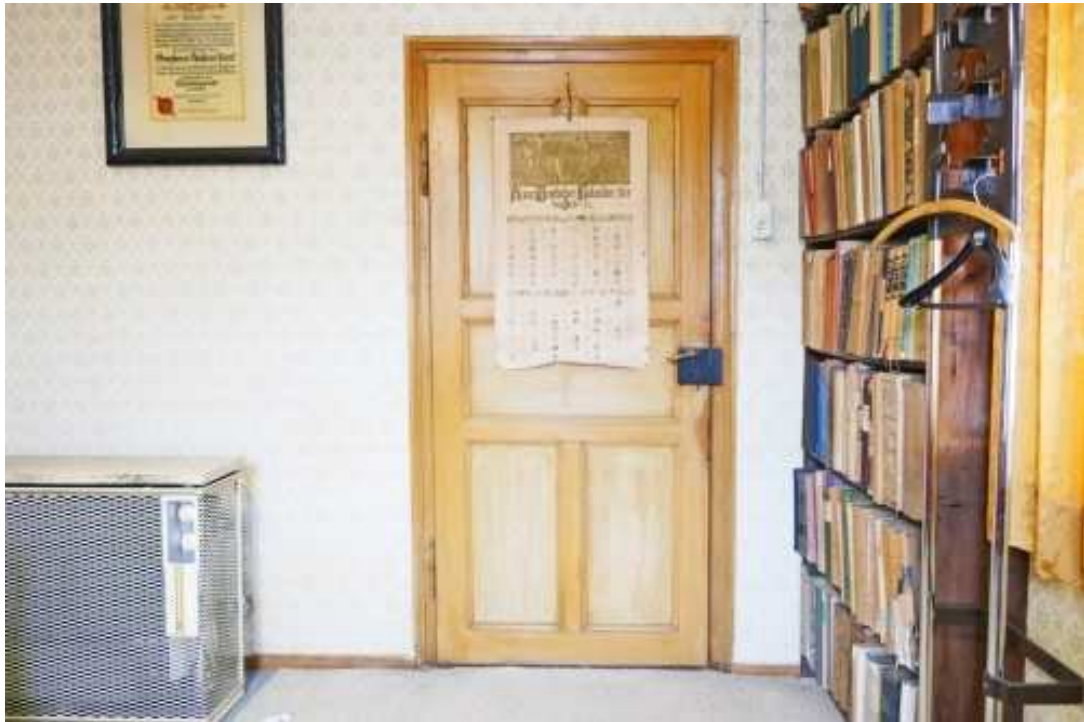
Schöne Kassetentüren mit aufgesetzter Klinke