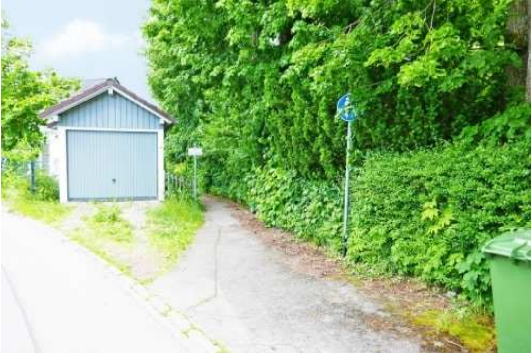
Fußweg zur Gartenrückseite