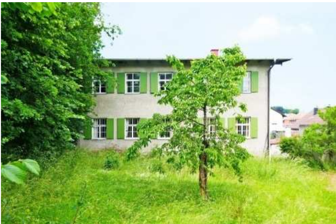
Blick vom Garten auf das das Magazin